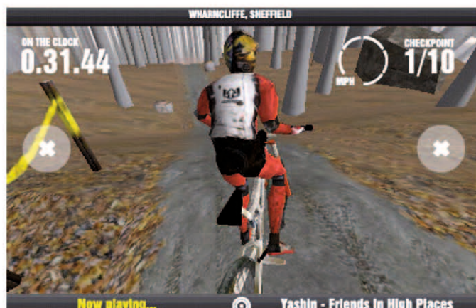
Uno screen shot del nuovo gioco Steve Peat Downhill

Peaty ha commentato con orgoglio: «Questo gioco avvicinerà molti alla Mtb e alle discipline più estreme». Greg Minnaar, Josh Bryceland, Rob Warner e Hans Ray